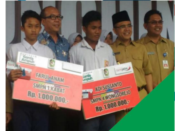
■ GARDA AMPUH