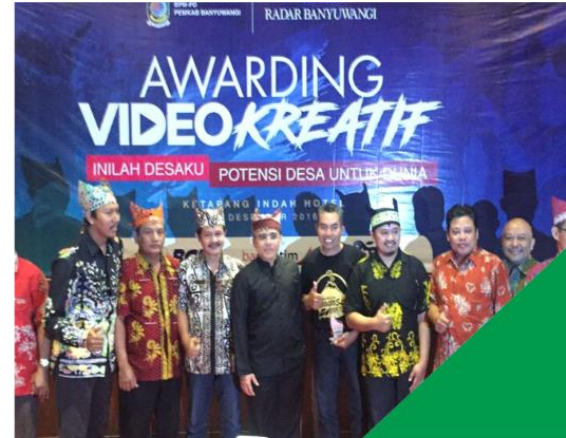
KOMPETISI VIDEO KREATIF