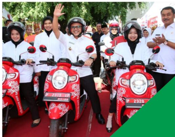
■ PROGRAM GANCANG ARON