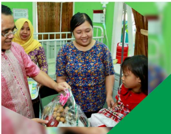
■ BIYA PENGGANTI KELUARGA PENUNGGU PASIEN RUMAH SAKIT