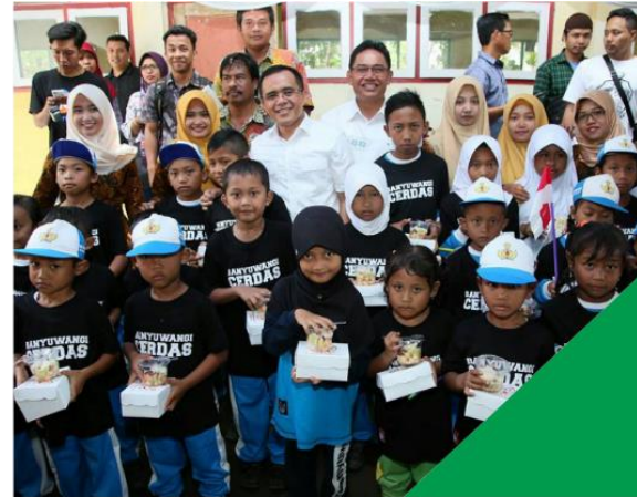
■ UANG SAKU SISWA