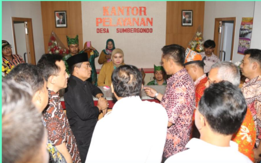
■ PROGRAM SMART KAMPUNG