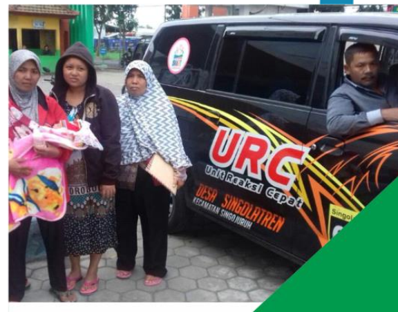
■ MOBIL PELAYANAN DESA