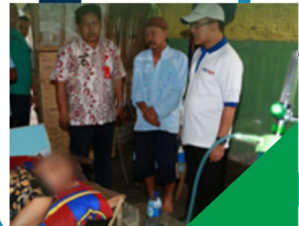
■ JEMPUT BOLA RAWAT WARGA