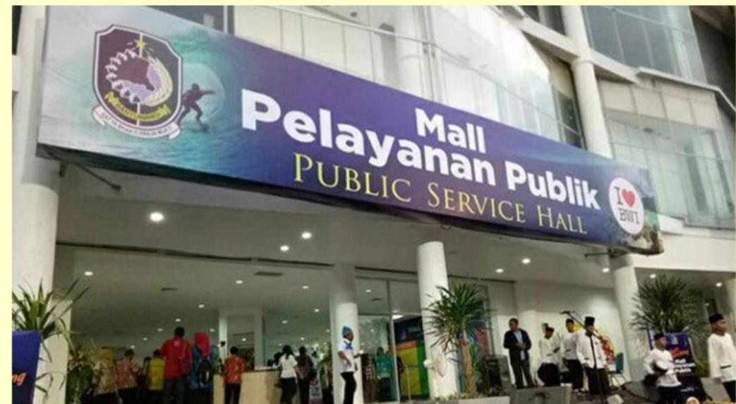
■ MALL PELAYANAN PUBLIK