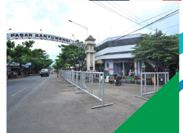
PENATAAN PASAR TRADISIONAL