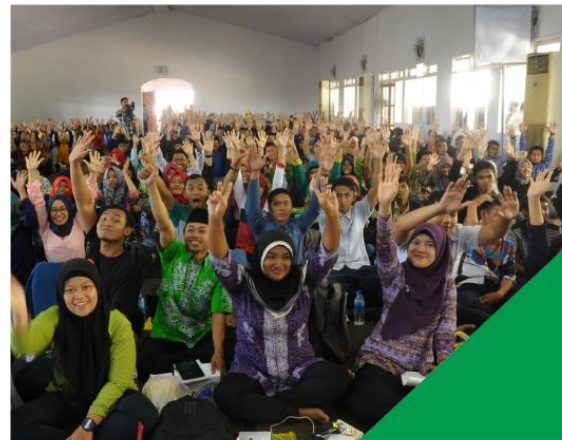
PELATIHAN INTERNET MARKETING