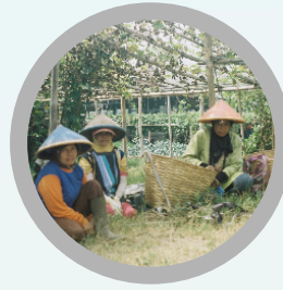
Petani / pengelola sumber pangan