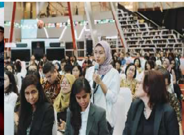
IFC's Launch Event & Discussion “Board Gender Diversity in ASEAN”