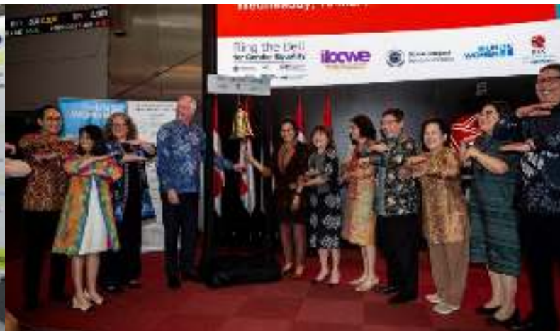
Ring the Bell for Gender Equality