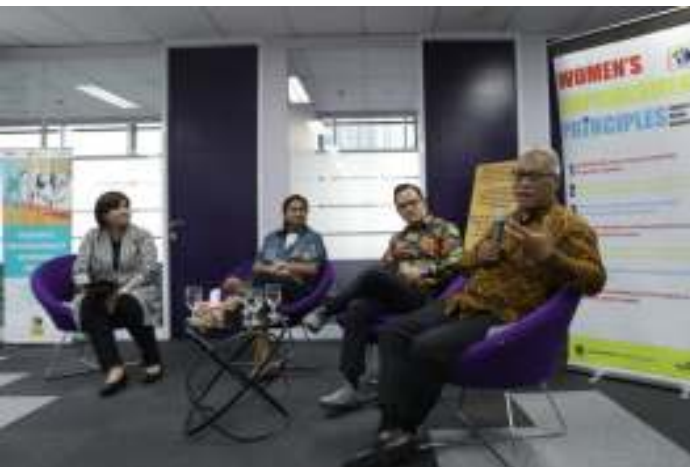
Sharing & Learning “Empowering Women in the Workplace and Community”