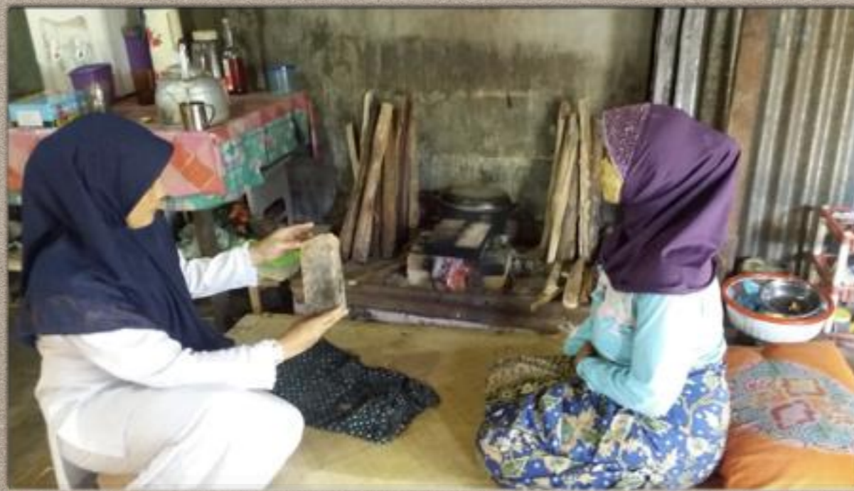
Prilaku Budaya lebih Sehat