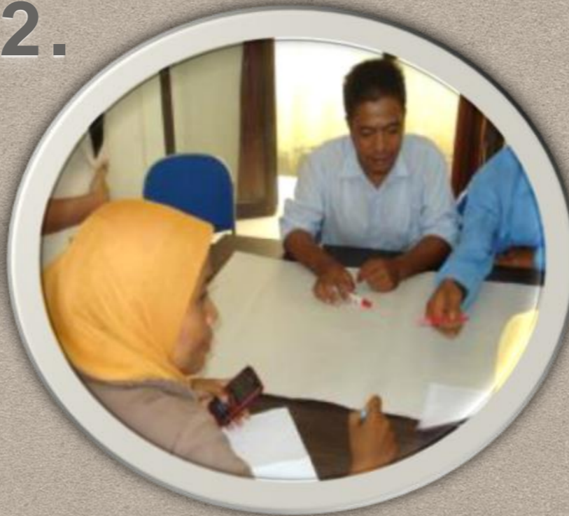
Koordinasi dgn MSF