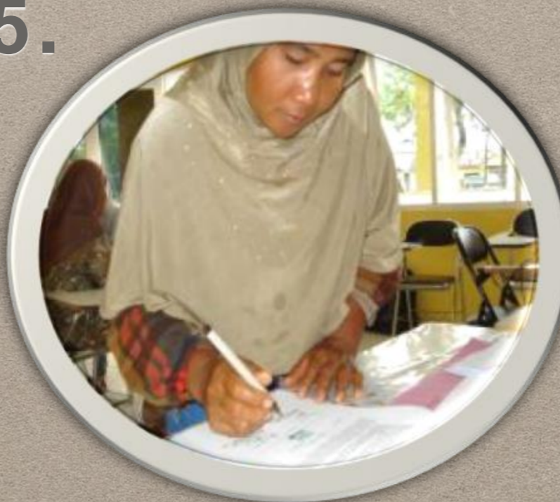
MOU dukun and bidan