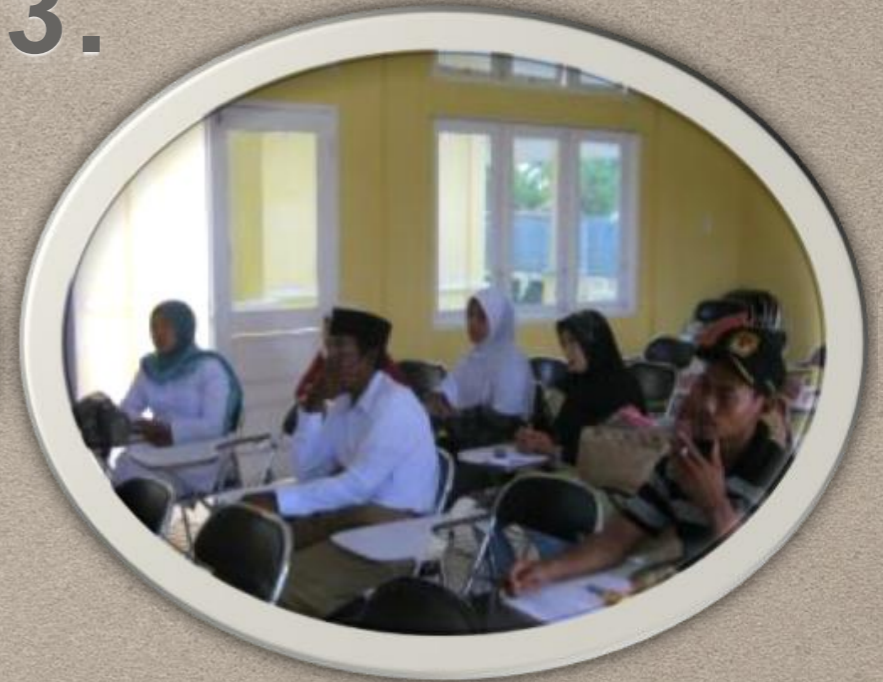
Penyamaan Persepsi MSF