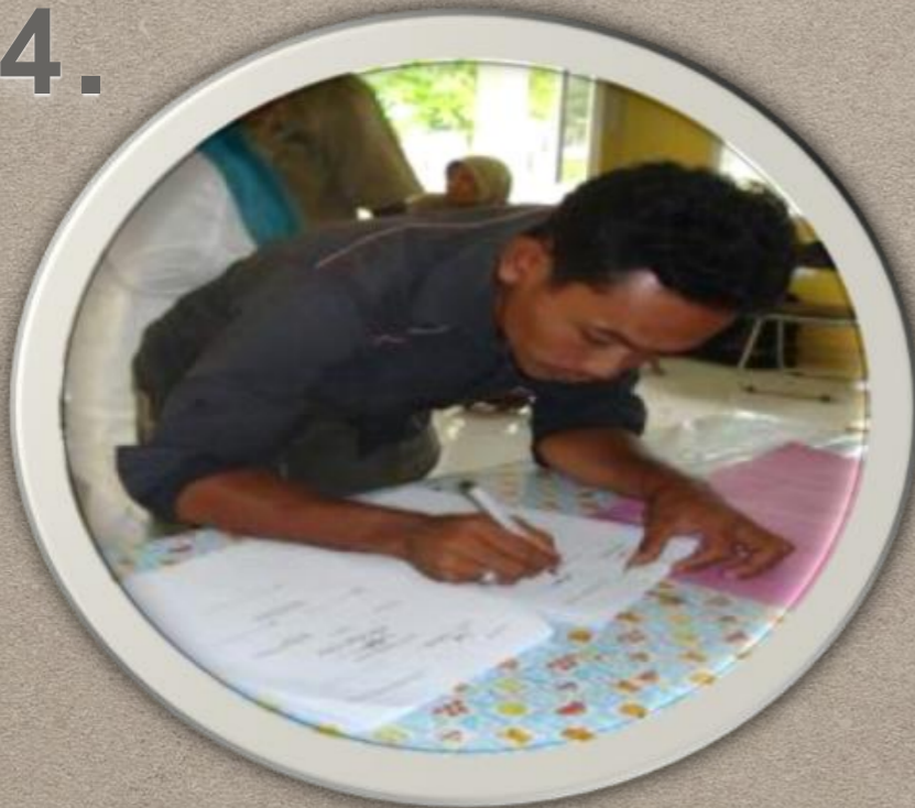
SK Kepala Desa