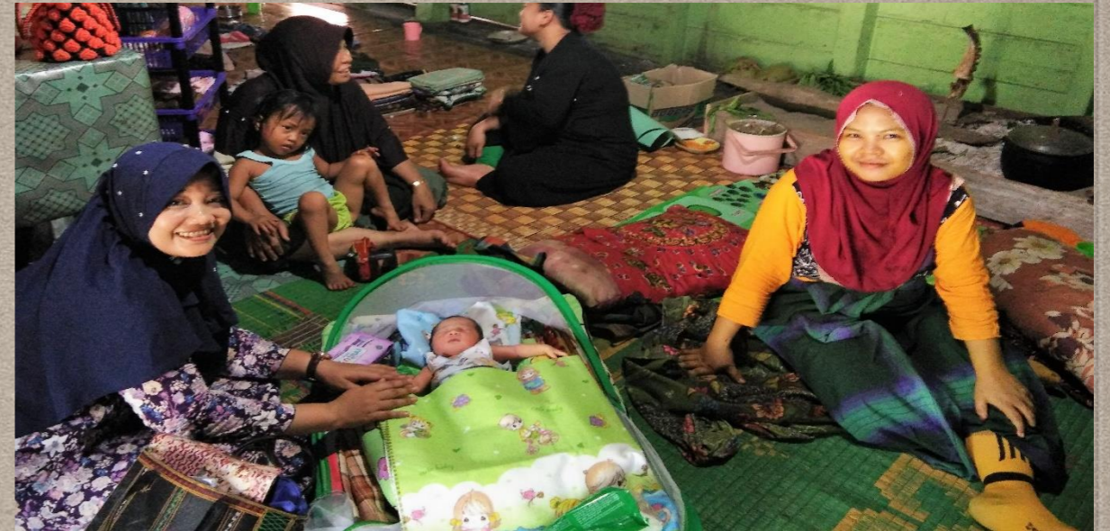
Tahun 2013: dikecamatan inovasi Kematian Ibu '0' Tahun 2018: Kematian Ibu diseluruh Kabupten '4' (replikasi)