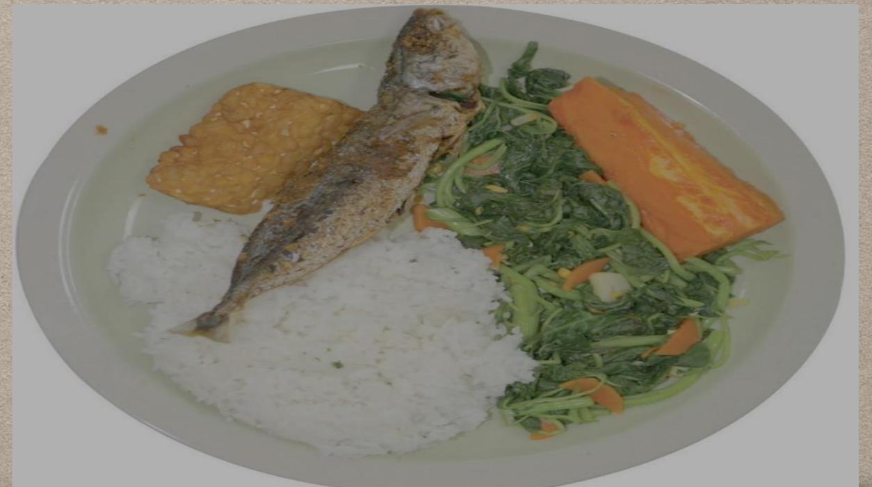
Perbaikan Nutrisi Ibu Nifas