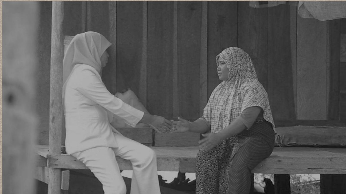
Kemitraan Bidan dan Dukun