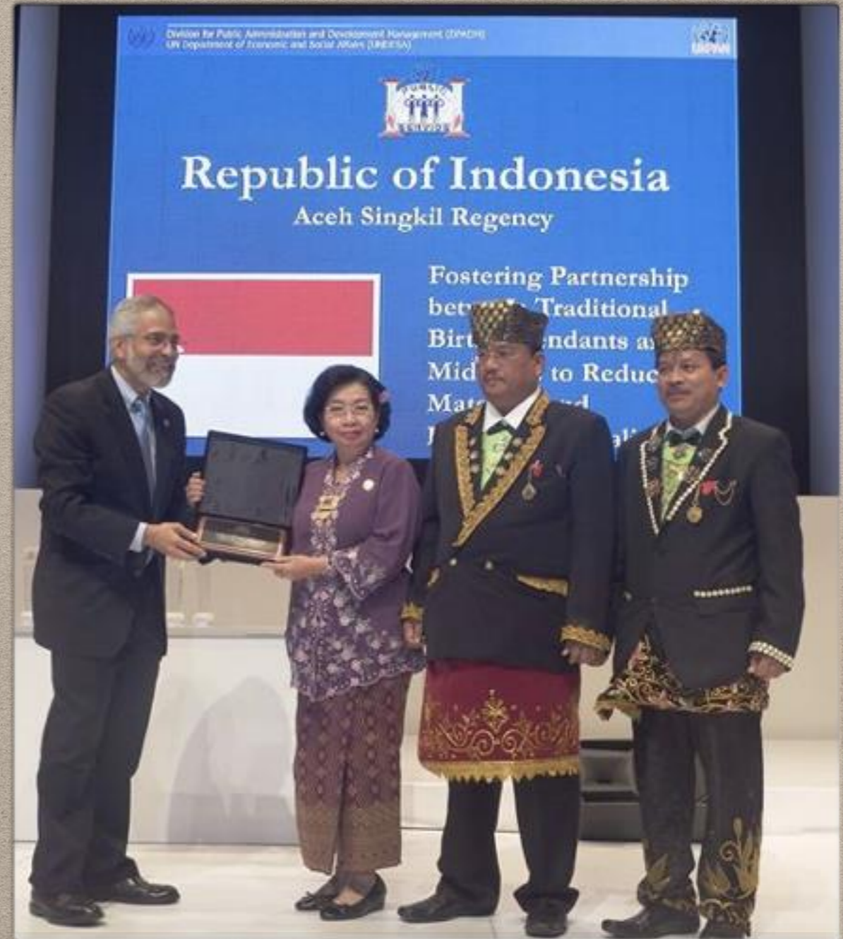
Juara II UNPSA 2015