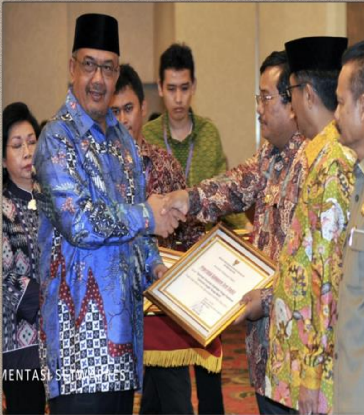
Simposium Inovasi Pelayanan Publik Indonesia 16-17 Juni 2014