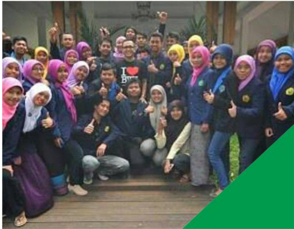
■ BEASISWA BANYUWANGI CERDAS