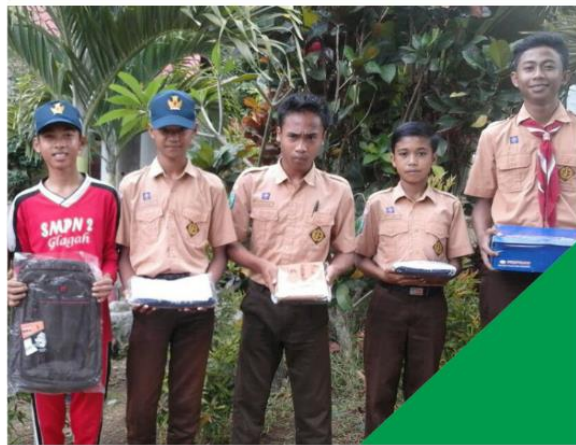
■ SISWA ASUH SEBAYA